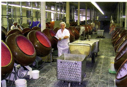
Auch Anforderungen wie Rückverfolgbarkeit von Zutaten und Mischungsverhältnissen werden mit der Software transparent: Geschäfts- und Produktionsprozesse laufen effizienter, wirtschaftlicher und harmonischer ab