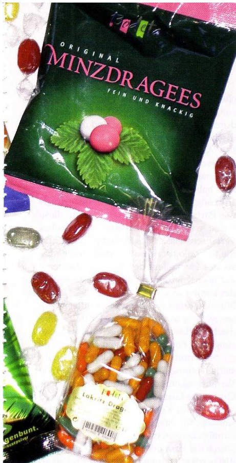
Die Prozesse in Produktion und Administration konnten mit der ERP-Software optimiert werden