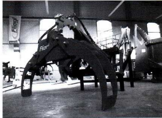
Die Fliegl Agro-Center GmbH in Kastl

Entscheidende Auswahlkriterien waren u. a. die Übernahme der Altdaten (Artikelstamm mit über 30.000 Artikeln) sowie die durchgängige Abbildung und damit effiziente Unterstützung der Geschäftsprozesse im Agro-Center. Nach einem umfangreichen Auswahlprozess fiel die Entscheidung auf SelectLine der Magdeburger SelectLine Software GmbH. Im März 2008 erfolgte der Produktivstart – SelectLine ist im Fliegl Agro-Center mit den Modulen Warenwirtschaft und Rechnungswesen mit derzeit 25 Lizenzen eingesetzt, die Daten der Finanzbuchhaltung werden über eine Schnittstelle an DATEV übergeben. Für Pascal Reichelt liegt ein wesentlicher Faktor, durch den sich SelectLine von Konkurrenz-Systemen abhebt, in der Funktionsvielfalt und dennoch hohen Flexibilität, die individuelle Anpassungen problemlos